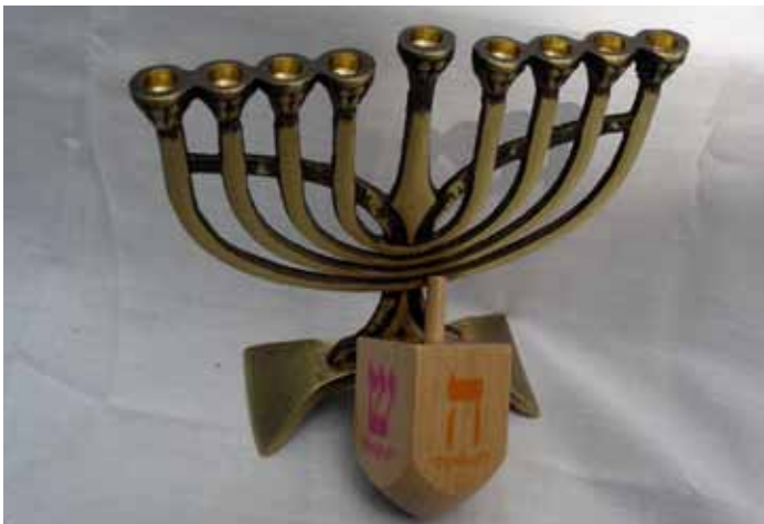
An Chanukka werden die Kerzen eines Leuchters nacheinander angezündet. Der Dreidel oder Kreisel ist Bestandteil eines beliebten Spiels, welches an Chanukka gespielt wird.

Seleukidenreich. Es war ein Gegner Roms. Die Seleukiden wurden von den Römern gezwungen, Ägypten aufzugeben. Auf dem Rückzug eroberten die Seleukiden 167 v. Chr. unter der Führung von König Antiochus IV. Jerusalem. Dort entweihten sie zum einen den Tempel und verboten die Ausübung der jüdischen Religion. Zum anderen versuchten sie den Juden das heidnische Hellenentum aufzuzwingen. Dies löste den