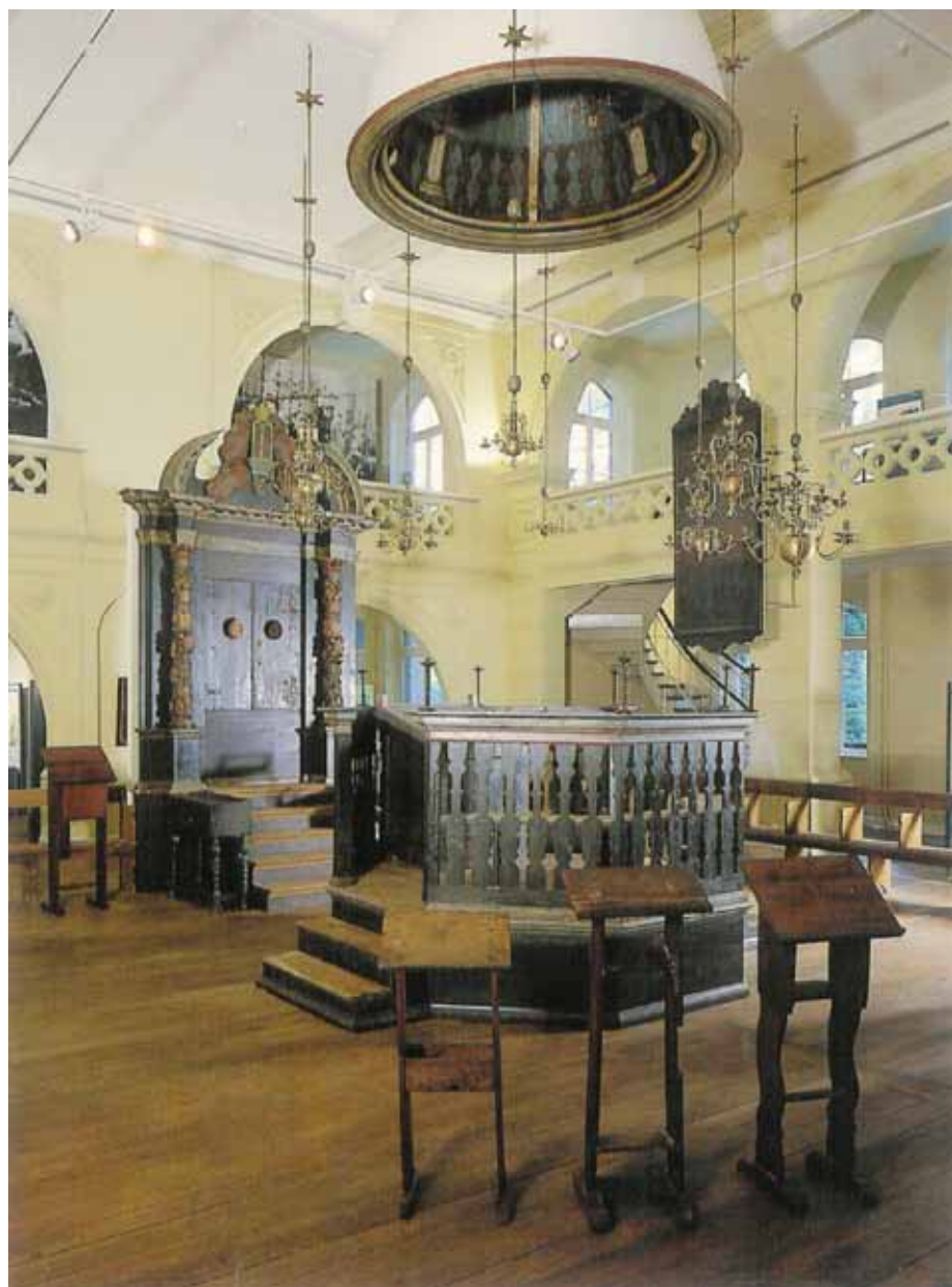
Die Hornburger Synagoge in der Jüdischen Abteilung des Braunschweigischen Landesmuseums