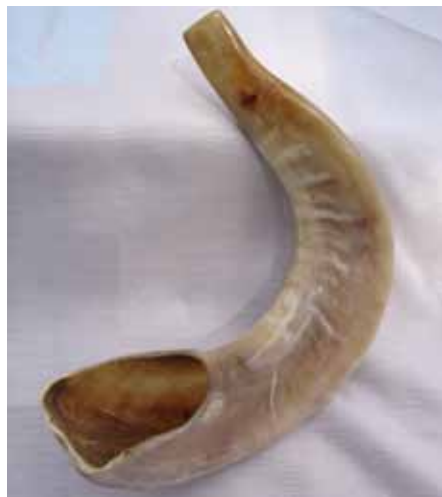
Am Neujahrsfest Rosch Haschna wird das Schofar, ein Widderhorn, geblasen.

ihm bedingungslos gehorcht, erlöst er ihn und schickt ihm einen Widder, den er anstelle seines Sohnes opfern kann.