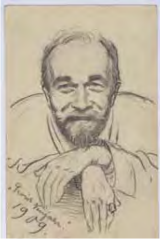
Karl Steinacker (1872 – 1944)

Ausstellungsstücke für das Museum. Auf seinen unermüdlichen Wanderungen durch die Region Braunschweig entdeckte