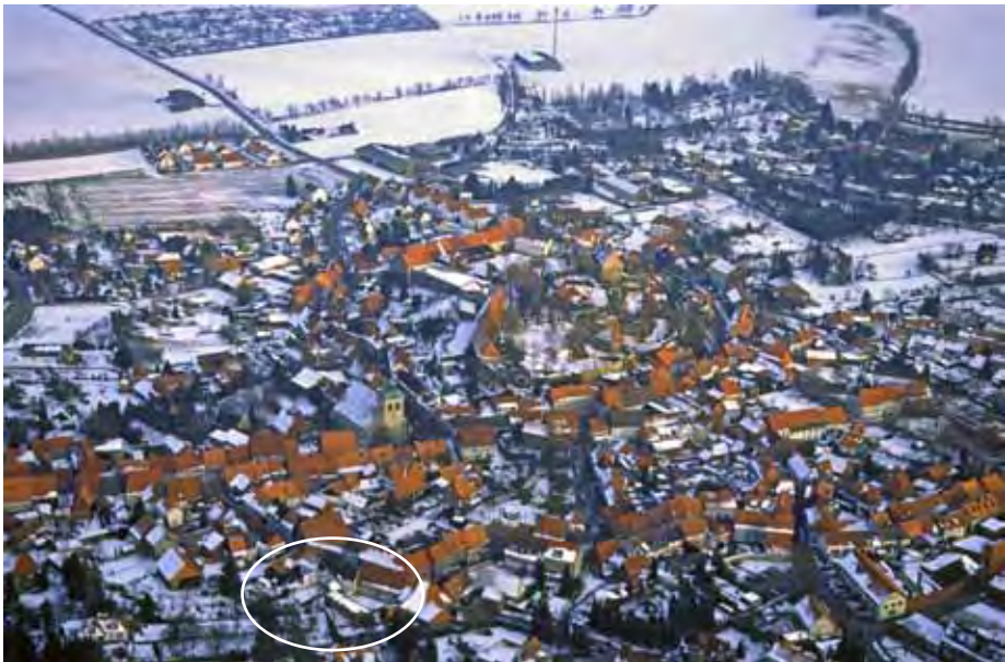
Luftaufnahme von Hornburg – im markierten Bereich stand die Synagoge.