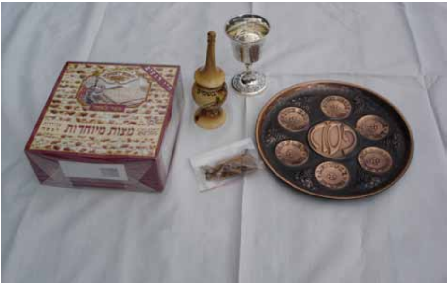
Zur Sederfeier am Pessachfest gehören das ungesäuerte Brot, Wein und besondere Gewürze.

Zu Beginn des Abends wird aus der Haggada , einer prachtvoll illustrierten Schriftrolle mit Texten, die von der ägyptischen Gefangenschaft erzählt, die Geschichte von der Gefangenschaft und dem Auszug aus Ägypten mit ihrem glücklichen Ende vorgetragen.