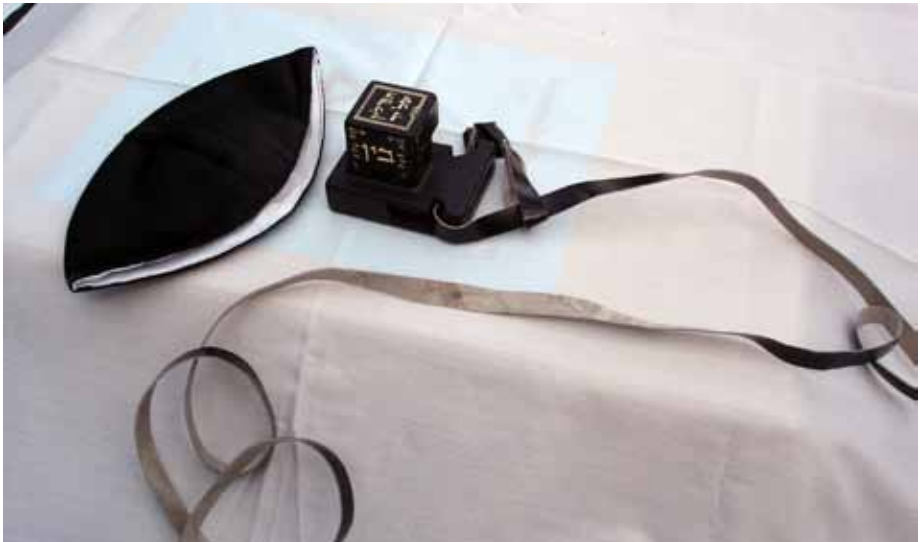
Männliche Juden tragen beim Gebet in der Synagoge die Kippa, eine Kopfbedeckung. Zum Gebet werden Kapseln mit Thorazitaten, die Tefillin, vor die Stirn und um den Arm gebunden.

Synagogen sind nicht nur Ort der Zusammenkunft, man sucht auch nach der Nähe Gottes. Laut der Überlieferung hatte Gott den Juden seine ständige Gegenwart durch die an Moses übergebenen Gesetzestafeln garantiert. Diese Tafeln wurden im Tempel von Jerusalem aufbewahrt. Sie befanden sich in einem abgetrennten Raum und galten als das Allerheiligste der Juden. Synagogen entstanden erst nach der Zerstörung des Jerusalemer Tempels und des Heiligtums. Das Zusammentreffen der Gemeinde zum Gebet sollte von diesem Zeitpunkt an die Nähe zu Gott ermöglichen, die einst das Allerheiligste garantierte. Im Gedenken an Jerusalem versammelt man sich und gibt dem Gebet mehr Ausdruck als im Einzelgebet möglich. Daher stellt die Synagoge den Ort der Präsenz Gottes dar.