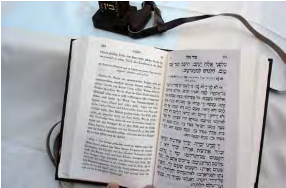
Die täglichen Gebete werden aus einem jüdischen Gebetbuch gelesen.