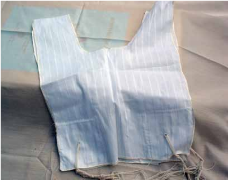
Der fromme Jude trägt einen kleinen Gebetsmantel, der am unteren Ende in Quasten endet.

Man wünscht sich am Abend des Festes ein gutes neues Jahr mit dem Satz: „Mögest du für ein gutes neues Jahr eingetragen und besiegelt werden.“ Es werden Speisen serviert, die in assoziativer Weise ein gutes Zeichen für das kommende Jahr setzen. So isst man Granatapfel (damit die Verdienste so zahlreich seien, wie die Körner des Apfels) und Honig (damit das Jahr süß wie Honig wird).