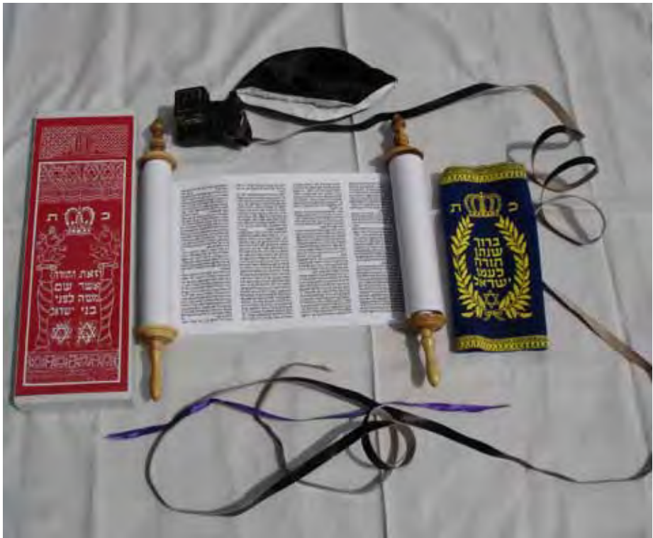
Die Thorarolle ist die wichtigste Grundlage für den jüdischen Glauben.

stattdessen eine Thorakrone aus Silber oder Gold, was die königliche Bedeutung der Schrift unterstreicht. Schließlich wird die Rolle, die mit ihrer gesamten Bekleidung bis über einen Meter hoch sein kann, in den Thoraschrein gelegt. Dieser ist mit einer Tür oder einem Vorhang aus kostbarem Stoff verschlossen, damit die Thora vor unberufenen Blicken geschützt ist. Nicht zuletzt aufgrund dieses ehrfurchtsvollen Umgangs bleiben Thorarollen oft mehrere Jahrhunderte erhalten. Ist eine Schriftrolle schließlich doch unbrauchbar geworden, so wird sie entweder verschlossen aufbewahrt oder auf einem Friedhof beerdigt.