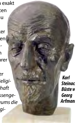
Karl Steinacker, Büste von Georg Arfmann

Steinacker hat bis zu seiner Frühpensionierung 1935 die Hornburger Synagoge vor dem Zugriff der Nationalsozialisten retten können. Ab 1935 wurde die Synagoge von den Nationalsozialisten ideologisch umgedeutet und missbraucht. Sie wurde nicht, wie viele Zeugnisse jüdischer Kultur, nach Prag verlagert, sondern blieb bis 1943 in Braunschweig öffentlich zugänglich. Nach dem Krieg wurde sie in einem Magazin des Landesmuseums eingelagert. Hierbei gingen Teile der hölzernen Decke der Synagoge verloren. Seit 1987 ist die Synagoge aus Hornburg zusammen mit der Sammlung von Zeugnissen jüdischen Lebens im Braunschweiger Land ausgestellt. 4